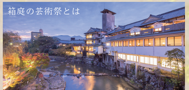
箱庭の芸術祭とは

ジャズピアニスト。2012年に初アルバム「About Me」をリリース。福岡を中心に様々な音楽シーンで活動を展開。