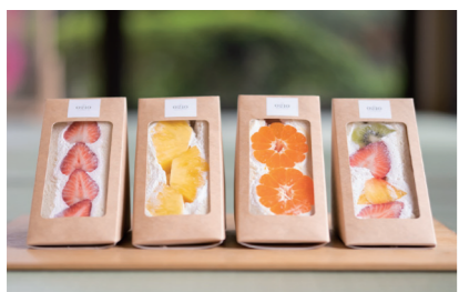
ローカルデリカテッセン 季設