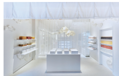
Made in ビエール・エルメ 和多屋別荘