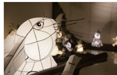
ランタンアート空間 鳥獣戯画