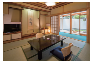
露天風呂付き客室