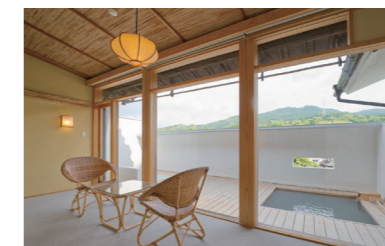
露天風呂付き客室

四季を感じながら湯浴みを楽しめる露天風呂とプライベートテラスが全室についた客室。月の満ち欠けや嬉野の山々を眺めながら思い思いの時間を過ごせます。