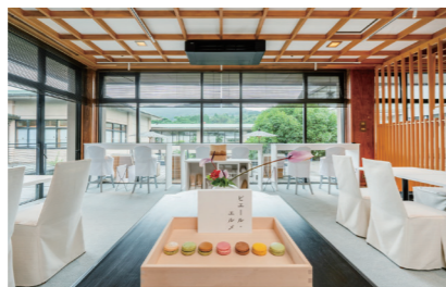
カフェ Made in ビエール・エルメ 和多屋別荘