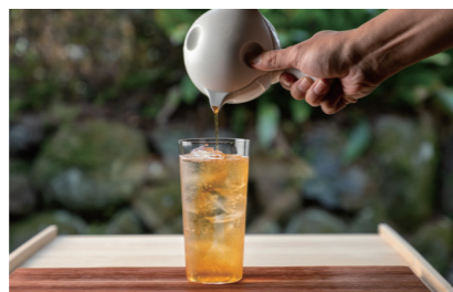
副島園 the BAR