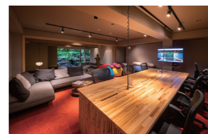
レンタルオフィス CAVE